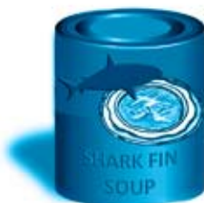
Ailerons : soupes